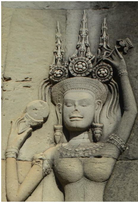
Code: A2-I-1-1.#8-1 (1)

ចម្លាក់អប្សរ Code: A2-I-1-1.#8-1(1)នេះមានគ្រឿងតាក់តែងលម្អលើក្បាលដោយមកុដកំពូល បី។ មកុដកំពូលបីនេះផ្សំឡើងដោយក្បាំងនិងកំពូលចំនួនបី ៖