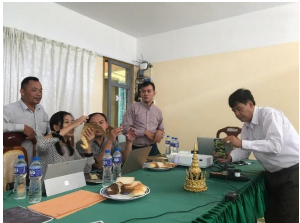
កិច្ចប្រជុំពិភាក្សាកំណត់អត្តសញ្ញាណគ្រឿងតុបតែងលម្អលើក្បាលនៃរូបចម្លាក់អប្សរា ជាមួយមន្ត្រីជំនាញមកពីសាកលវិទ្យាល័យភូមិន្ទវិចិត្រសិល្បៈ នៅវិទ្យាស្ថានវប្បធម៌និងវិចិត្រសិល្បៈ