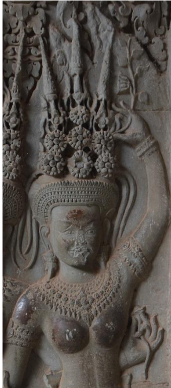
Code: A-CG-1.#1-1 (2)

ចម្លាក់អប្សរ Code: A-CG-1.#1-1 (2) នេះមានគ្រឿងលំអតុបតែងលើក្បាលដោយមកុដកំពូលបី។ មកុដកំពូលបីនេះផ្សំឡើងដោយក្បាច់និងកំពូលចំនួនបី៖