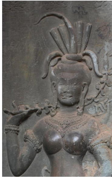
Code: A3-O-1-1.#1-1 (2)

ចម្លាក់អប្សរ Code: A3-O-1-1.#1-1 (2) នេះមានម៉ូតសក់ផ្ទៀងមួយច្បូតឡើងលើ និងពត់ចុងសក់ រាងកោងមកចំហៀងខាងស្តាំ ។ ម៉ូតសក់អប្សរនេះមានតាក់តែងលំអដោយស្លៀតផ្កាចំនួនប្រាំបីសៀតពី ក្រោយផ្ទៀងសក់ ដែលនៅក្នុងនោះមានស្លៀតផ្កាចំនួនបួន(កណ្តាល)ស្លៀតឡើងលើ ហើយស្លៀតផ្កា ទាំងបួនទៀតនៅចំហៀងសងខាង ដែលម្ខាងៗមានស្លៀតផ្កាចំនួនពីរ ស្លៀតពត់ទម្លាក់ចុះ ។