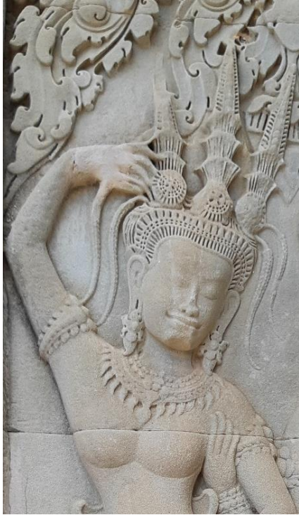
Code: A2-I-1-2.#1-2 (2)

ចម្លាក់អប្សរ Code: A2-I-1-2.#1-2 (2) នេះមានគ្រឿងលម្អតាក់តែងលើក្បាលដោយមកុដកំពូលបី។ មកុដកំពូលបីនេះផ្សំឡើងដោយក្បាំងនិងកំពូលចំនួនបី៖