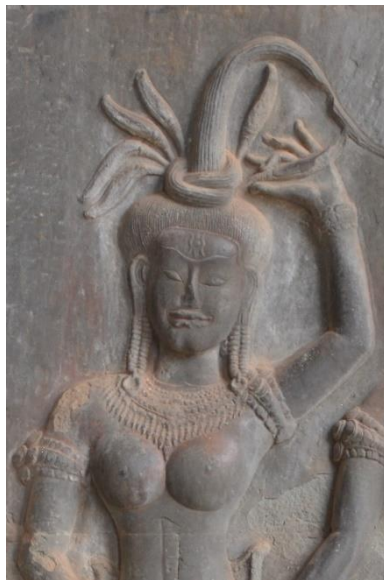
Code: A3-O-1-1.#2-2 (4)

ចម្លាក់អប្សរ Code: A3-O-1-1.#1-1 (2) នេះមានម៉ូតសក់ផ្ទៀងមួយច្បូតឡើងលើ និងពត់ចុងសក់ រាងកោងមកចំហៀងខាងស្តាំ ។ ម៉ូតសក់អប្សរនេះមានតាក់តែងលំអដោយស្លៀតផ្កាចំនួនប្រាំបីសៀតពី ក្រោយផ្ទៀងសក់ ដែលនៅក្នុងនោះមានស្លៀតផ្កាចំនួនបួន(កណ្តាល)ស្លៀតឡើងលើ ហើយស្លៀតផ្កា ទាំងបួនទៀតនៅចំហៀងសងខាង ដែលម្ខាងៗមានស្លៀតផ្កាចំនួនពីរ ស្លៀតពត់ទម្លាក់ចុះ ។