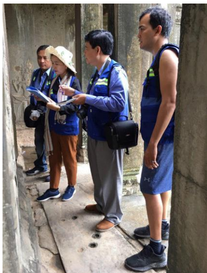
សកម្មភាពក្រុមស្រាវជ្រាវធ្វើការផ្ទៀងផ្ទាត់ រូបគំនូរចម្លងនិងចម្លាក់អប្សរាពិតនៅប្រាសាទអង្គរវត្ត