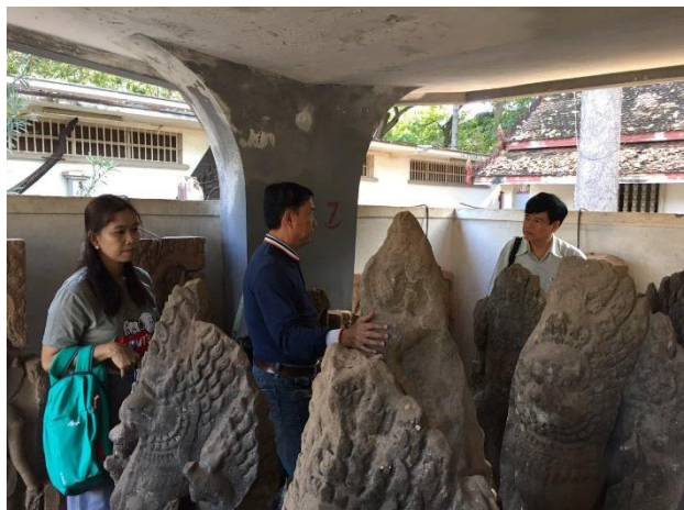
សកម្មភាពក្រុមស្រាវជ្រាវចុះសិក្សារូបអប្សរា នៅសារមន្ទីរអភិរក្សអង្គរ