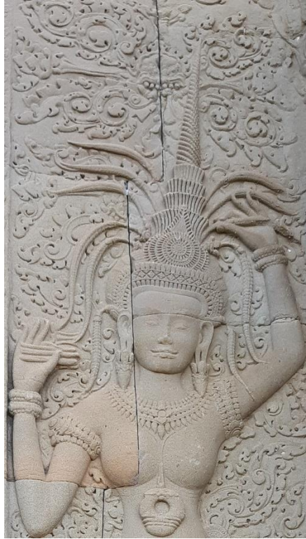
Code: A4-I-1-1.#12-1 (1)

ខាងក្រោមនេះជាការលើកយករូបអប្សរខ្លះៗមកបរិយាយពីសិល្បៈតែងលម្អរលើក្បាលនិងសក់៖ ចម្លាក់អប្សរផែន A4