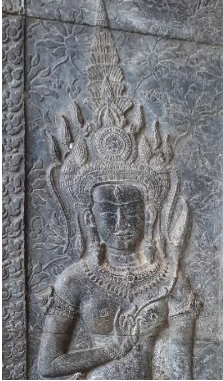
Code: A4-O-1-1.#8-1 (1)

ចម្លាក់អប្សរ Code: A4-O-1-1.#8-1 (1)នេះ មានគ្រឿងតាក់តែងលម្អលើក្បាលដោយមកុដ កំពូលមួយ ។ មកុដកំពូលមួយនេះផ្សំឡើងដោយក្បាំងនិងកំពូលមួយ ៖