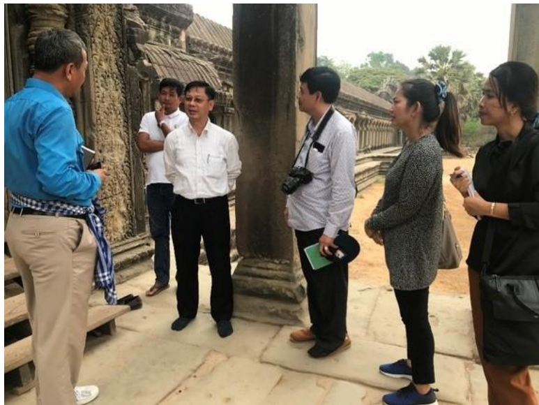
ក្រុមការងារជួបពិគ្រោះយោបល់ជាមួយឯកឧត្តមបណ្ឌិត ហង់ ពៅ អគ្គនាយកអាជ្ញាធរជាតិអប្សរា នៅប្រាសាទអង្គរវត្ត