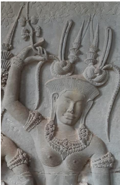
Code: A-CG-1.#4-1 (4)

មកុដនេះមានគ្រឿងលម្អតាក់តែងបន្ថែមដោយស្នៀតរំយោលសងខាងចំនួនបី រចនាក្បាច់ទម្រង់ដូចគ្នា។