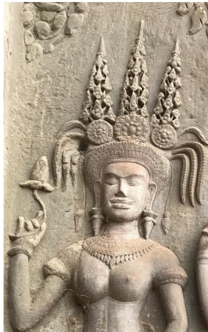
Code: A1-O-1-1.#8-1 (2)

មកុដនេះមានគ្រឿងលម្អតាក់តែងបន្ថែមដោយស្នៀតរំយោលនៅសងខាងចំនួនពីរ រចនាក្បាច់ ទម្រង់ដូចគ្នា ។