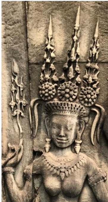
Code: A1-O-1-1.#2-1 (2)