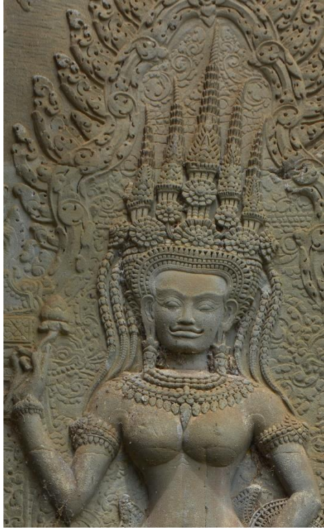
Code: A4-I-8-3.#21-1 (1)

ចម្លាក់អប្សរ Code:A4-I-8-3.#21-1(1)នេះមានគ្រឿងលម្អតាក់តែងលើក្បាលដោយមកុដកំពូល ប្រាំ ។ មកុដកំពូលប្រាំនេះផ្សំឡើងដោយក្បាំងនិងកំពូលចំនួនប្រាំ ៖