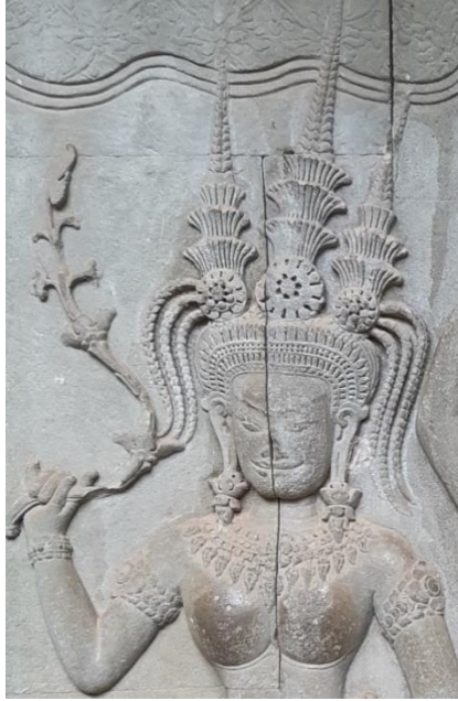
Code: A-CG-1.#2-4 (4)

ចម្លាក់អប្សរ Code: A-CG-1.#2-4 (4) នេះមានគ្រឿងលម្អតាក់តែងលើក្បាលដោយមកុដកំពូលបី។ មកុដកំពូលបីនេះផ្សំឡើងដោយក្បាំងនិងកំពូលចំនួនបី ៖