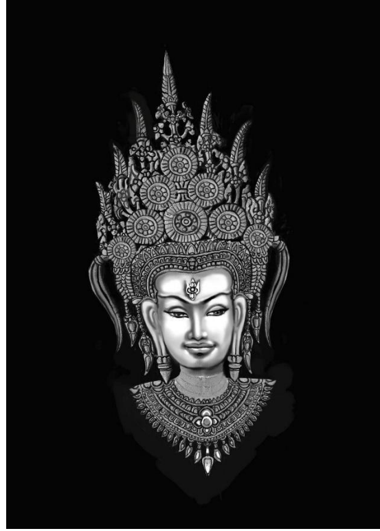
Code: A4-O-1-1. #5-2 (2)