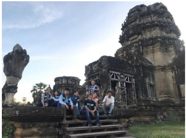
ក្រុមស្រាវជ្រាវថតរូបអប្សរានិងចុះលេខកូដអប្សរានៅប្រាសាទអង្គរវត្ត