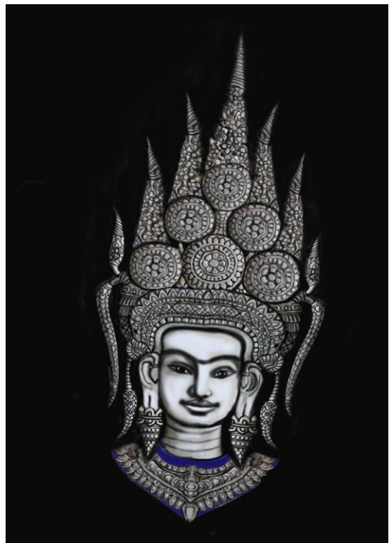
Code: A4-O-1-1.#4-2 (2)