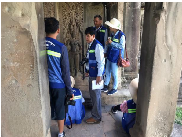
សកម្មភាពក្រុមស្រាវជ្រាវចុះសិក្សាផ្ទាល់និងថតរូបនៅប្រាសាទអង្គរវត្ត