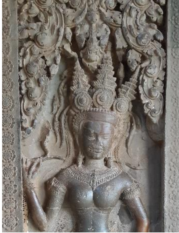
Code: A4-O-1-1.#1-1 (1)

ចម្លាក់អប្សរ Code: A4-O-1-1.#1-1(1) នេះមានគ្រឿងលម្អតាក់តែងលើក្បាលដោយមកុដកំពូលបី។ មកុដកំពូលបីនេះផ្សំឡើងដោយក្បាំងនិងកំពូលចំនួនបី ៖