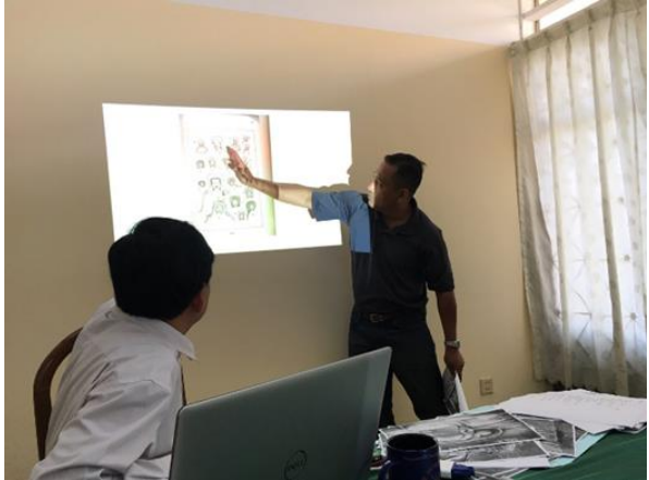
កិច្ចប្រជុំពិភាក្សារបស់ក្រុមការងារមុនពេលចុះអនុវត្តគម្រោងនៅវិទ្យាស្ថានវប្បធម៌និងវិចិត្រសិល្បៈ