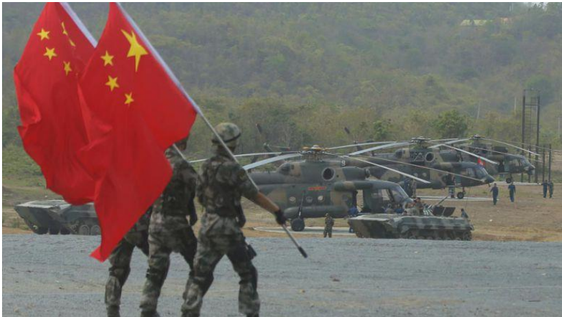
ទិដ្ឋភាពក្នុងសមយុទ្ធនាគមន៍ រវាងយោធាកម្ពុជានិងយោធាចិននាពេលកន្លងមក