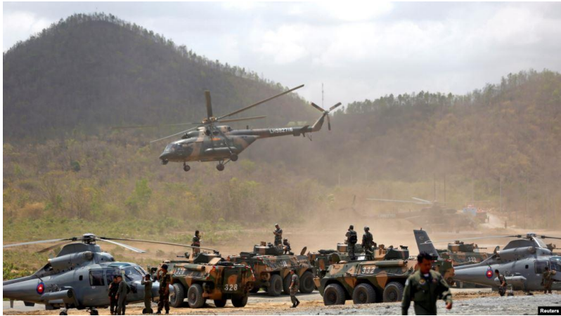
ទិដ្ឋភាពក្នុងសមយុទ្ធនាគមន៍ រវាងយោធាកម្ពុជា និងយោធាចិន នាពេលកន្លងមក

នៅក្នុងខែមិថុនា ឆ្នាំ២០១៨ ដំណើរទស្សនកិច្ចរបស់ឯកឧត្តម Wei Fenghe រដ្ឋមន្ត្រីការពារជាតិចិន នៅរាជធានីភ្នំពេញ ភាគីចិនបានចុះហត្ថលេខា ផ្តល់ជំនួយយោធាក្នុងតម្លៃទឹកប្រាក់ប្រមាណ ១០០លានដុល្លារអាមេរិកបន្ថែមដល់កម្ពុជា។