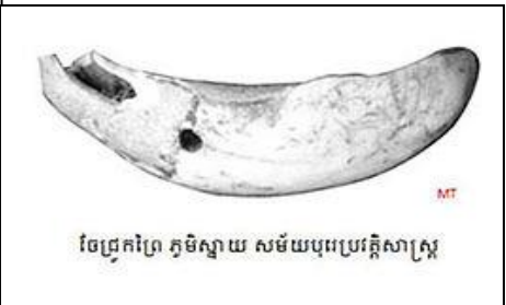
ច្រកព្រៃ ភូមិស្វាយ សម័យបុរេប្រវត្តិសាស្ត្រ

ព្រះរាជាណាចក្រកម្ពុជា ឬអាណាចក្រខ្មែរ គឺជាទឹកដីដែលមានវ័យចំណាស់ជាយូរលង់ណាស់ មកហើយ ពេលគឺតាំងពីមុន គ.ស. មកម៉្លេះ នេះបើយោងតាមការធ្វើកំណាយនៅល្អាងស្ពាននិងម្លូ រំព្រៃ ហើយក៏ជាអាណាចក្រដែលពេញទៅវត្ថុស័ក្តិសិទ្ធិនានា និងជំនឿផ្សេងៗផងដែរ។ វត្តមាន ជំនឿលើទឹកដីកម្ពុជានេះ មានតាំងពីយូរ គឺយូរជាងការចូលមកដល់នៃព្រហ្មញ្ញសាសនា និងព្រះ