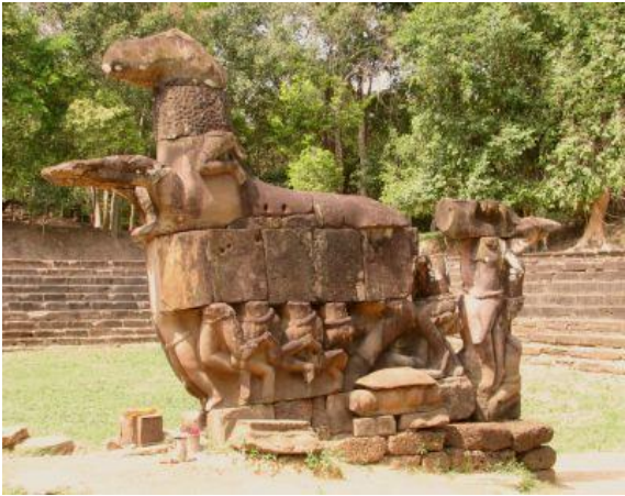
ព្រះអវលោកេស្វរៈ និងមិត្តជា សេះពលាហកៈ ប្រកប ៖ រូបថតស្រាវជ្រាវឆ្នាំ២០០៦