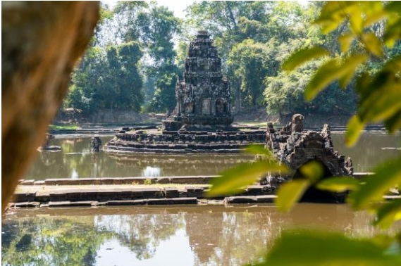
ប្រាសាទនាគព័ន្ធ ថតនៅខែមករា ឆ្នាំ២០២២

នៅខាងមុខប្រាសាទរាជ្យស្រី ហៅនាគព័ន្ធ មានសេះមួយកំពុងហោះលឿនស្ទើរមានចង្កើម មនុស្សតោងកន្ទុយ ជា បដិមាព្រះ បាទជ័យវរ្ម័ន ទី៧ ដែលមានន័យថា “ព្រះអង្គដឹកជញ្ជូនសត្វ លោកពីមហា សាគរ គឺវាលវដ្តសង្សារត្រែកពទៅ កាន់ ទីក្សេមក្សាន្ត គឺ ព្រះនិព្វាន” ១៧ ។ សេះនេះ មានឈ្មោះថាពលាហកៈ។