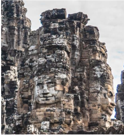
ព្រះក្រ្តិព្រះពោធិសត្វ អវលោកិតេស្វរៈ នៅ លើកំពូលប្រាសាទប្រាសាទបាយ័ន។

នៅក្នុង សិល្បៈស្ថាបត្យកម្មខ្មែរ គេច្រើនធ្វើមុខ ៤ នៅកំពូលប្រាសាទឬកំពូលចេតិយសម្គាល់ថា ជាព្រះក្រ្តិ នៃអវលោកិតេស្វរៈ ដើម្បីការពារ កយន្តរាយទាំងពួងប៉ុន្តែបើហោតាមលទ្ធិព្រាហ្មណ៍ ថា មុខព្រហ្ម។ គេអាចហៅអវលោកេស្វរៈ ក៏បាន ហៅលោកេស្វរៈ (Lokesvara) ក៏បាន ១៥ ។