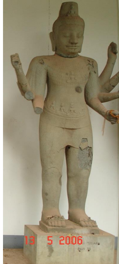
បដិមាព្រះពោធិសត្វ អវលោកិតេស្វរៈ ដែល ប្រកពៈ ក្រសួងអភិរក្សអង្គរ រូបថតស្រាវជ្រាវ ឆ្នាំ ២០០៦

ចំពោះបដិមាពោធិសត្វអវលោកិតេស្វរៈ ដែលឬដែល ក្នុងសិល្បៈចម្លាក់បុរាណ សិល្បៈករ ខ្មែរ ច្រើនធ្លាក់រូប ពោធិសត្វនេះជារូបបុរស វ័យក្មេង មានព្រះហស្ត ៤ កាន់ ផ្កាឈូក, ខ្សែផ្កាំ, គម្ពីរ និង ដបទឹក។