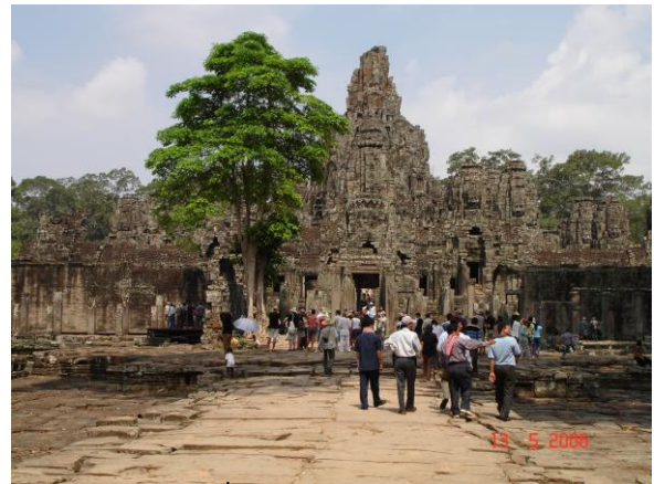
ប្រាសាទបាយ័នជាការគោរពសកលទេពបូជា (ព្រះពុទ្ធ, ព្រាហ្មណ៍, ព្រះពោធិសត្វ, និងមនុស្ស)

នៅប្រាសាទ ជ័យស្រី ហៅ ព្រះខាន់ ព្រះបាទជ័យវរ្ម័នទី៧បានកសាងបដិមាព្រះ វររាជបិតាជា តួអង្គ ពោធិសត្វលោកេស្វរៈ ថ្វាយព្រះនាមថា “ជ័យវរមេស្វរៈ” តម្កល់ទុកក្នុង ប្រាសាទជ័យស្រី នេះ ក្នុង ព.ស.១៧ ៣៤ (គ.ស.១១៩១) ១៨ ។