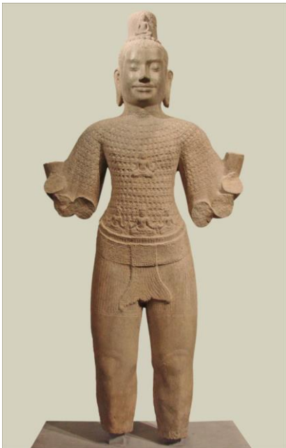
បដិមាពោធិសត្វព្រះអវលោកេស្វរៈ

នៅក្នុង សិល្បៈស្ថាបត្យកម្មខ្មែរ គេច្រើនធ្វើមុខ ៤ នៅកំពូលប្រាសាទឬកំពូលចេតិយសម្គាល់ថា ជាព្រះក្រ្តិ នៃអវលោកិតេស្វរៈ ដើម្បីការពារ កយន្តរាយទាំងពួងប៉ុន្តែបើហោតាមលទ្ធិព្រាហ្មណ៍ ថា មុខព្រហ្ម។ គេអាចហៅអវលោកេស្វរៈ ក៏បាន ហៅលោកេស្វរៈ (Lokesvara) ក៏បាន ១៥ ។