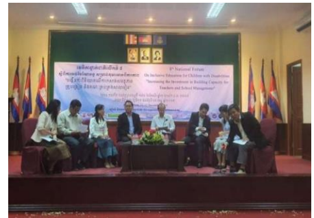
រូបភាពវេទិកាជាក់ជាតិលើកទី៨ស្តីពីការអប់រំបរិយាបន្នស្តីពី«បង្កើនការវិនិយោគលើការកសាងសមត្ថភាពគ្រូបង្រៀននិងគណៈគ្រប់គ្រងសាលារៀនអំពីការអប់រំបរិយាបន្នសម្រាប់កុមារមានពិការភាព» រៀបចំនៅរាជធានីភ្នំពេញ ថ្ងៃទី១១ ខែធ្នូ ឆ្នាំ២០១៩

នេះបញ្ជាក់ពីការទទួលខុសត្រូវសីលធម៌ ដើម្បីធានាថាក្រុមដែលងាយរងគ្រោះបំផុត ត្រូវបានត្រួតពិនិត្យតាមដានដោយយកចិត្តទុកដាក់ និងនៅក្នុងករណីចាំបាច់វិធានការត្រូវបានធ្វើឡើង ដើម្បីធានាវត្តមាន ការចូលរួម និងការសម្រេចរបស់ពួកគេនៅក្នុងប្រព័ន្ធអប់រំ។ 13