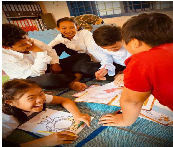
រៀនដោយស្នាមញញឹម របស់កុមារមានពិការភាព

អ្នកស្រាវជ្រាវណែនាំថា ការលេងគឺជា ធាតុផ្សំសំខាន់ក្នុងការរៀនសូត្រ អនុញ្ញាតឱ្យ កុមារធ្វើត្រាប់តាមអាកប្បកិរិយារបស់មនុស្ស ពេញវ័យ អនុវត្តជំនាញសំខាន់ៗ ដែលមាន ដំណើរការប្រកបដោយចិត្តរំភើប និងរៀន ច្រើនអំពីពិភពលោករបស់ពួកគេ។ 14